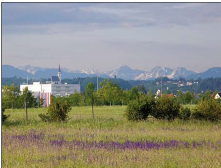
Abb 16: Ein Jahr vor dem Konzert sah die Konzertfläche so aus. Heute breitet sich hier eine Wüste, deren Wunden nur langsam heilen.