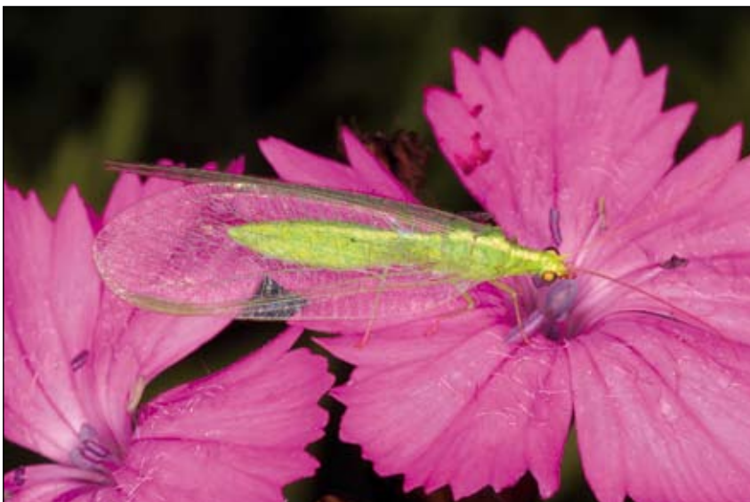
Abb. 1: Kartäusernelke mit Florfliege

Der Landkarten-Raublattrüsselkäfer ( Mogulones geographicus - Abb. 9) wurde seit 1926 in Oberösterreich nicht mehr nachgewiesen bis er 2008 auf dem Welser Flugplatz wieder entdeckt wurde. Dieser auffällig gefärbte Käfer ist an Natternkopf ( Echium vulgare ), der hier reichlich vorkommt, gebunden. Eine andere Rüsselkäferart, Brachysomus villosulus , war sogar über 90 Jahre in Oberösterreich verschollen. Auch ihn haben