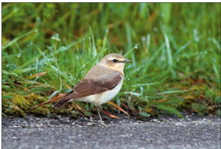
Abb. 14: Steinschmätzer ( Oenanthe oenanthe ) ist regelmäßig als Durchzügler anzutreffen.