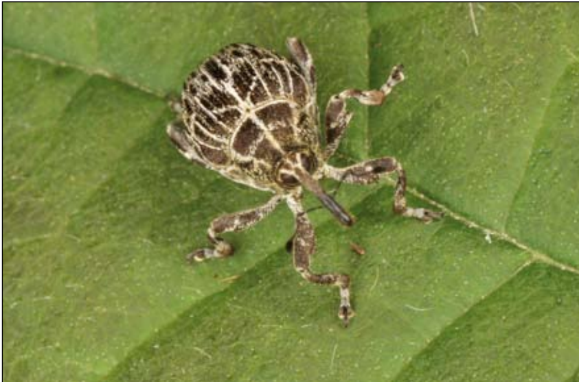
Abb. 9: Landkarten-Raublattrüsselkäfer ( Mogulones geographicus )