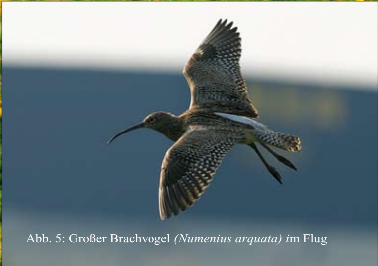
Abb. 5: Großer Brachvogel ( Numenius arquata ) im Flug