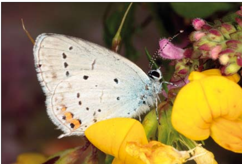
Abb. 11: Kurzschwänziger Bläuling ( Cupido argiades )

Insektenkundler in den vergangenen Jahren auf dem Welser Flugplatz festgestellt. Das Verbreitungszentrum dieser bemerkenswerten Art liegt im äußersten Osten von Österreich sowie in den angrenzenden, trockenen und sehr warmen Gebieten der Slowakei, Ungarns und Rumäniens. Es wird vermutet, dass diese Art besonders sensibel auf Veränderungen ihres Lebensraums reagiert, da sie an vielen geeignet erscheinenden Standorten nicht mehr gefunden werden konnte.