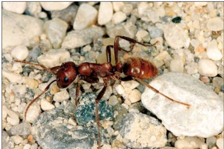
Abb. 12: Amazonenameise ( Polyergus rufescens )

kommt es kaum zu Kämpfen. Warum wehren sich die Überfallenen nicht? Hier spielt eine „Kriegslist“ der Amazonen eine wichtige Rolle. Sie versetzen durch einen bestimmten Duft, dem „Propagandapheromon“, die Sklavenameisen in Panik. Ein Kampf wäre aber ohnehin aussichtslos, denn die Amazonenameisen haben als Dolche ausgebildete Oberkiefer, mit denen sie andere Ameisen rasch töten können. Allerdings können sich Amazonenameisen nicht mehr selbständig ernähren. Sie müssen von ihren Sklaven gefüttert werden. Die aus den erbeuteten Larven und Puppen geschlüpften Arbeiterinnen sind deshalb für die Betreuung und Versorgung der Amazonenameisen und deren Nachwuchs zuständig (SEIFERT 1996).