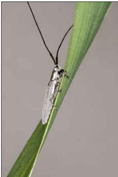
Abb. 13: Getreidebock ( Calamobius filum )