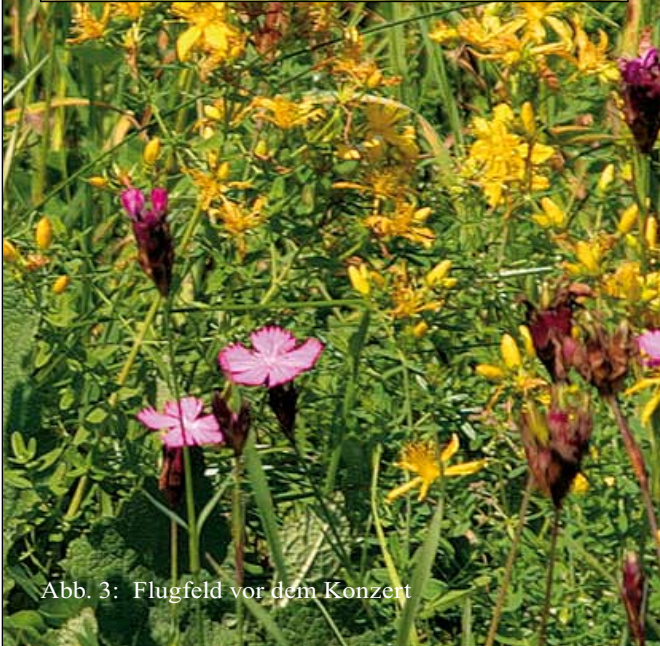
Abb. 3: Flugfeld vor dem Konzert