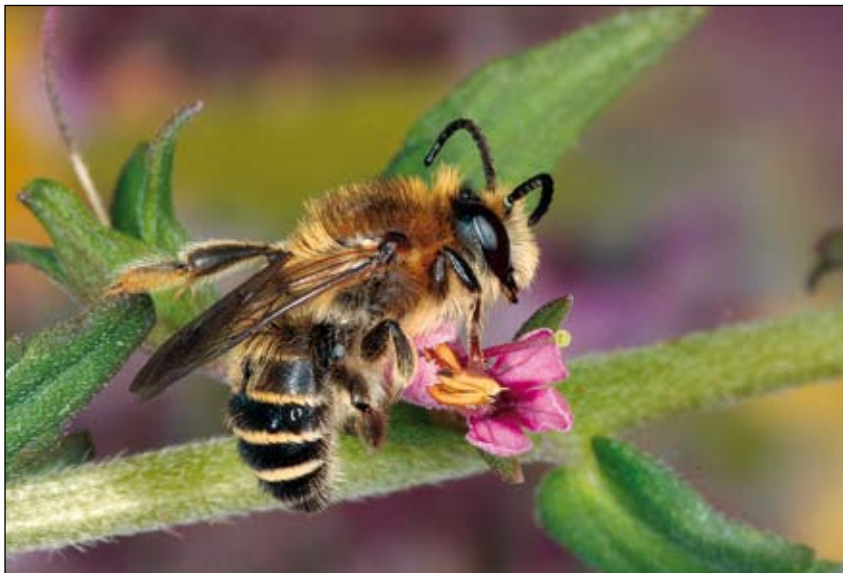
Abb. 10: Zahnrost-Sägehornbiene ( Melitta tricincta ) Männchen