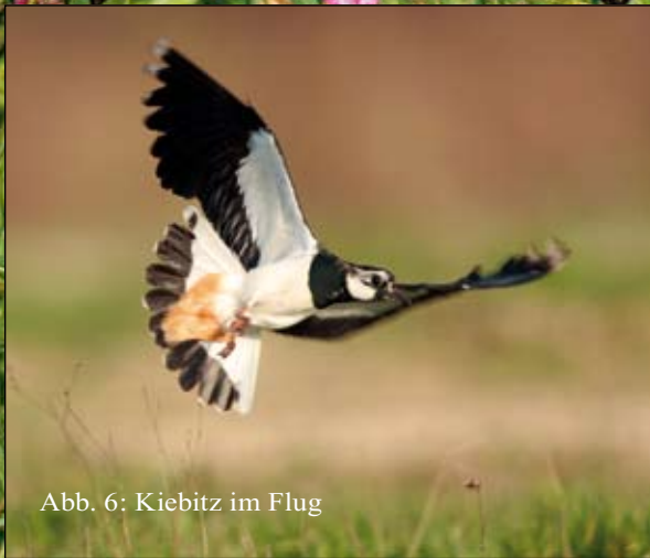
Abb. 6: Kiebitz im Flug