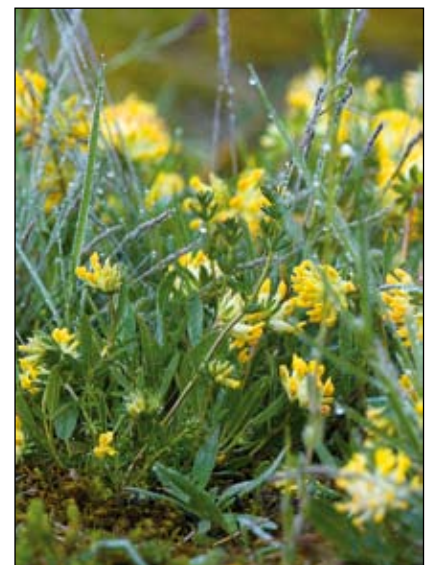
Abb. 2: Dichte Bestände von Wundklee