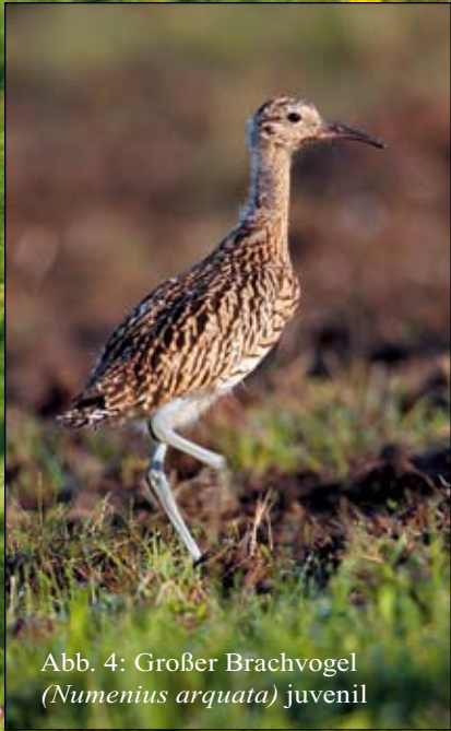
Abb. 4: Großer Brachvogel ( Numenius arquata ) juvenil