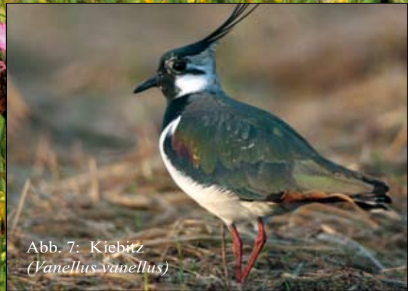
Abb. 7: Kiebitz ( Vanellus vanellus )