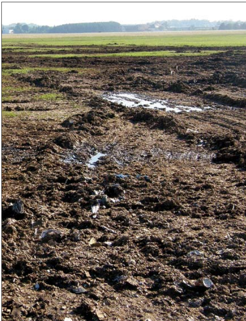
Abb. 15: Verwüstete Flächen am Flugplatz Wels nach dem Konzert

Ausschlaggebend für die hohe naturschutzfachliche Wertigkeit der Wiesen auf dem Welser Flugplatz ist die geringe Verfügbarkeit von Nährstoffen für die Vegetation, weshalb hier großflächig Magerwiesen vorkommen. Die eingebrachten Hackschnitzel wirken sich aber wie eine Düngung aus und stellen dadurch eine massive Beeinträchtigung der Magerwiesen dar. Nur ein Teil der Hackschnitzel wurde nachträglich wieder entfernt. Teilweise sind die auf dem Flugplatzgelände verbliebenen Hackschnitzel in den Boden eingearbeitet worden. Durch das Aufbringen der Hackschnitzel sind mit größter Sicherheit schnell lösliche Nährstoffe in den Boden gelangt, die auch bei einer vollständigen Entfernung der Hackschnitzel im Boden verbleiben und eine unerwünschte Düngewirkung zur Folge haben. Aus diesem Grund und aufgrund des großflächigen Rohbodens ist es unbedingt notwendig, die weitere Entwicklung der Vegetation zu verfolgen und ein auf die sich entwickelnde Vegetation abgestimmtes Pflegekonzept auszuarbeiten. Es muss gewährleistet werden, dass invasive Neophyten und andere für den Lebensraum Magerwiese unerwünschte Arten sich hier aufgrund der guten Keimbedingungen auf dem vegetationsfreien Boden nicht etablie-